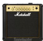
AMPLI GUITARE REAMPING Backstage

- Prévoir une pièce proche du plateau pour isoler et placer l'ampli guitare